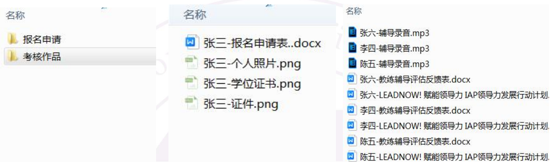
图 1 ICLC-485-张三

考试文件夹命名为“ ICLC-期数-姓名 ”，如 ICLC-485-张三，即表示第 485 期 LEAD NOW!国际认证赋能领导力教练班 张三。主文件夹下新建“ 报考申请 ”和“ 考试作品 ”文件夹进行文件归类，如图 1、图 2、图 3。